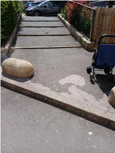
Accessibilité des piétons au Marché de la Marne