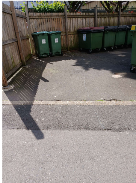
Accessibilité des poubelles