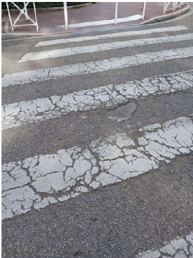
Avant (septembre 2024)