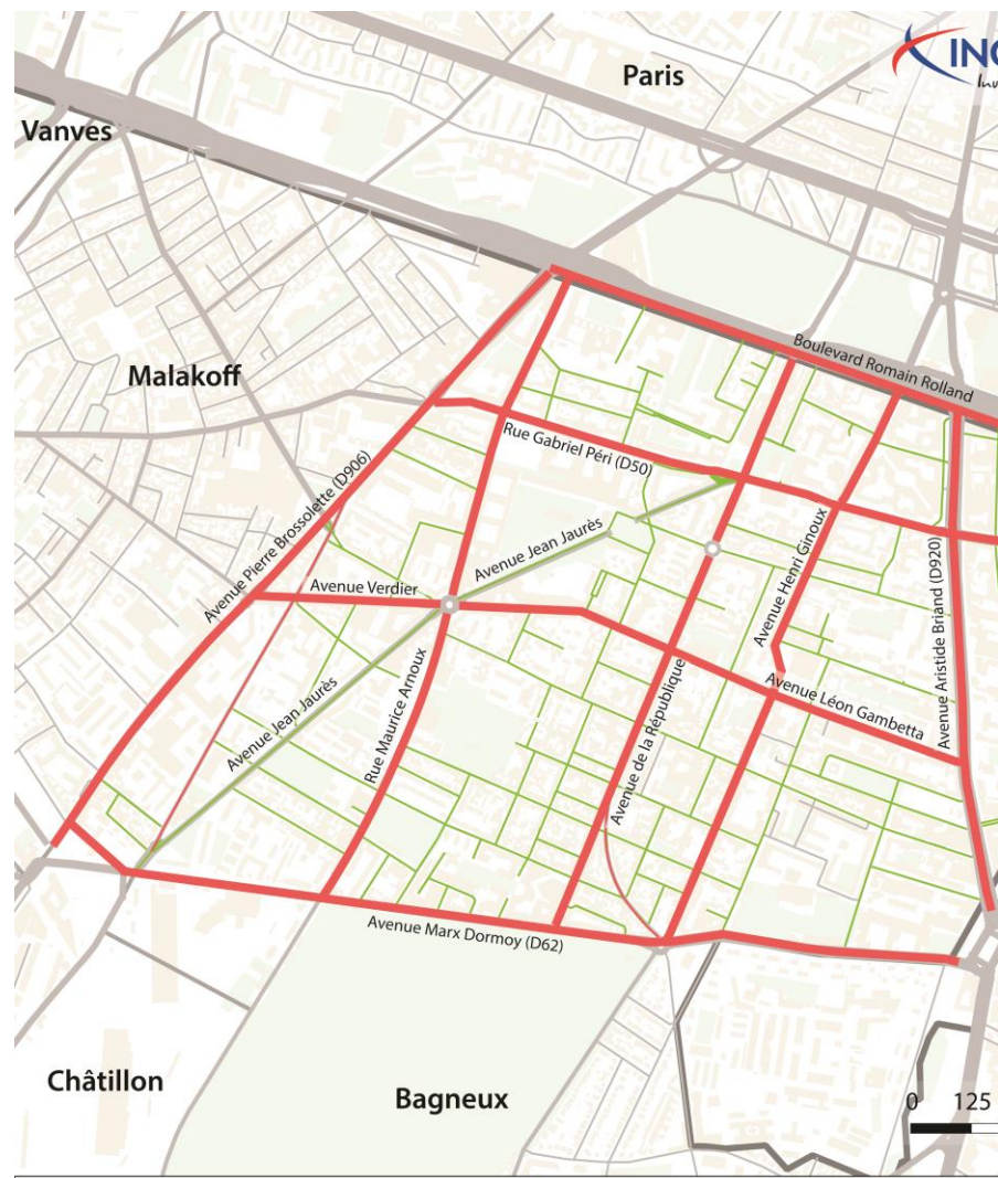
Généralisation de la zone 30 dans les quartiers — Limitation de la vitesse à 30 km/h (ou moins ponctuellement) — Conservation de la limitation à 50 km/h (grands axes communaux, voies départementales et Paris)